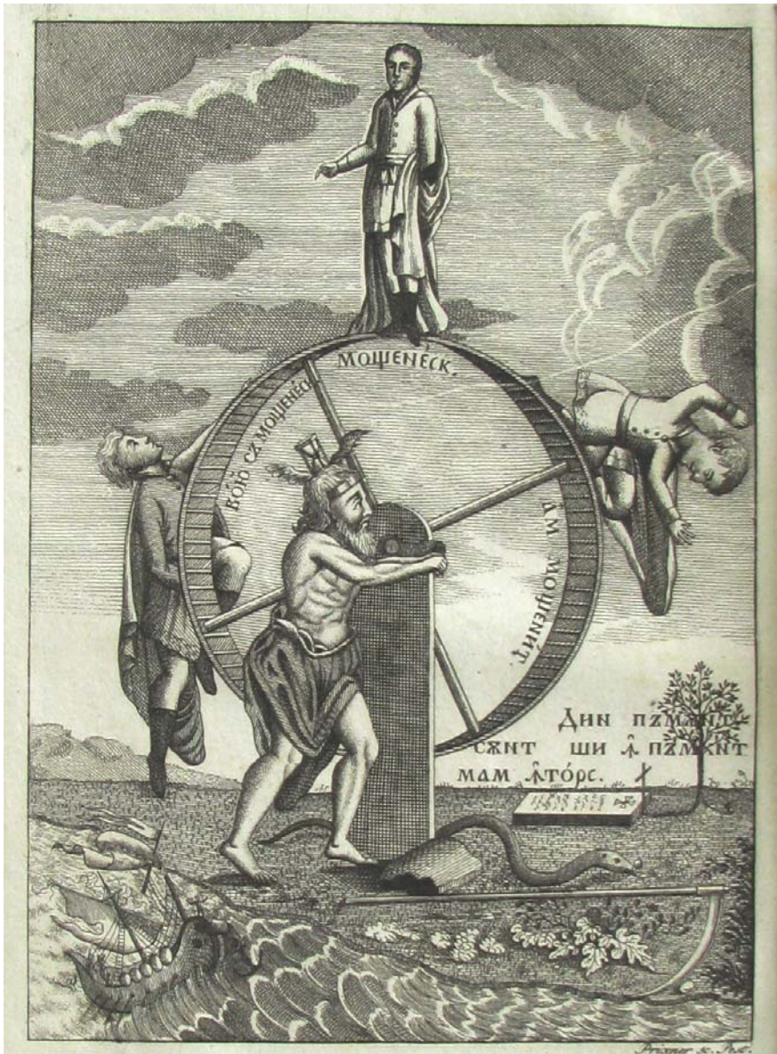
Fig. 1. Prixner, Roata vieții , gravură în metal, Calendar pe 100 de ani , Buda, 1814.