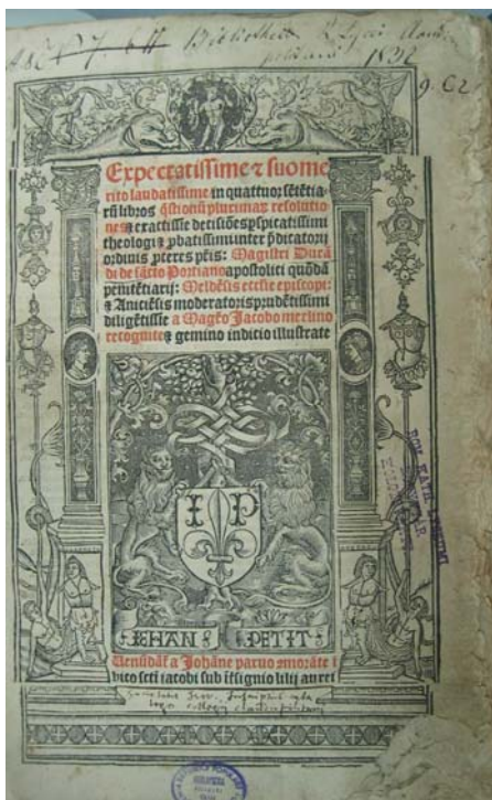
Figura 5 - 1515