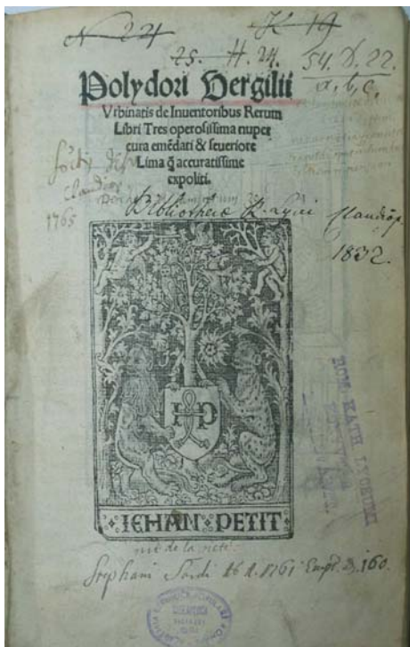
Figura 7 - 1505