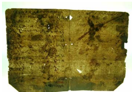
Imagine la negatoscop a unei file cu lipsuri cauzate de diferiți factori

Atacul biologic: s-a desfășurat pe două planuri: insectele au lăsat în urmă rosături, cavități, respectiv găuri de zbor.