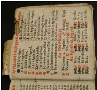
Analogie copertă; frontispiciu; prima pagină identică

din legătoria respectivă (conțin scris, sau modele imprimate ce dau de știre că sunt doar fragmente și nu proiectate special drept copertă). Un alt caz observat este acela când, înainte de frontispiciu, mai există o pagină velină ce face parte dintr-o dublă legată în primul fascicol (sau chiar într-un altul).