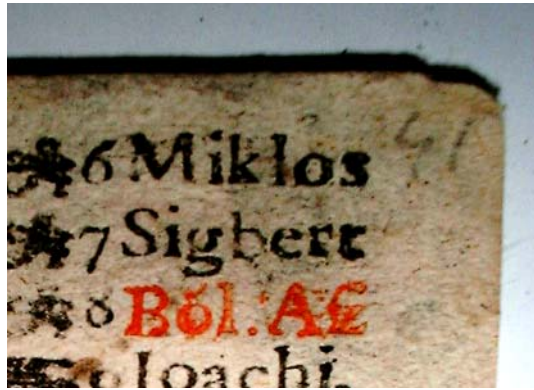
Imaginea unei file numerotate

slăbite sau chiar rupte. Privitor la structura volumului, putem observa că, paginile au fost grupate într-un număr inegal, pe cinci fascicule.