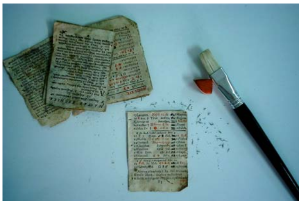
Curățire uscată cu pensula și radiera