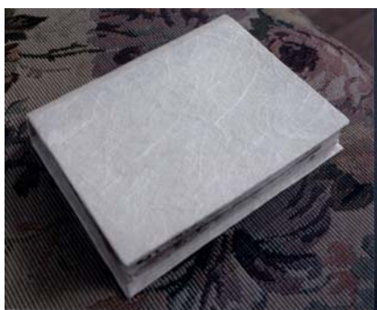
Imagini înainte și după restaurare, Detalii din timpul restaurării