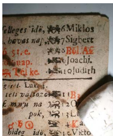
și după curățirea mecanică

Curățirea uscată a fost urmată de o curățire umedă . Dar mai întâi s-au efectuat teste de curățire pentru verificarea solubilității cernelurilor. Deși,