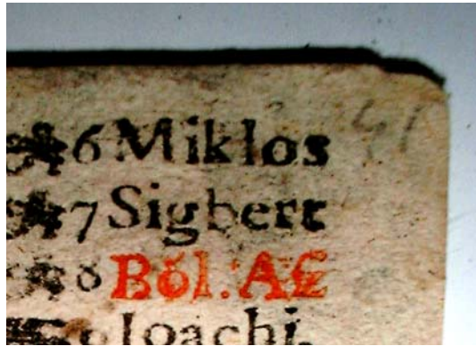
Imaginea unei file numerotate

slăbite sau chiar rupte. Privitor la structura volumului, putem observa că, paginile au fost grupate într-un număr inegal, pe cinci fascicule.