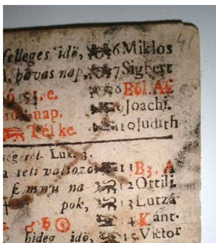
Detaliu înainte ...