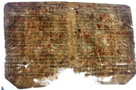
file cu lipsuri