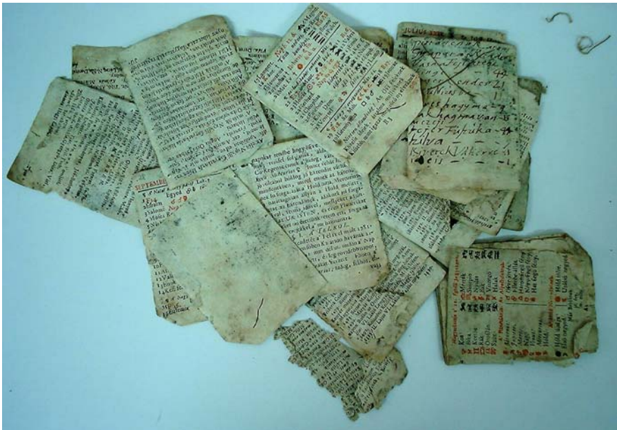
Imagine de ansamblu după descoaserea filelor

După descoasere s-a putut face o curățire uscată mai profundă cu ajutorul pensulei, respectiv cu ajutorul radierii în zonele mai îmbâcsite.