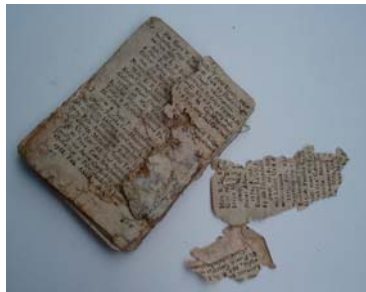
Imaginea față și verso a volumului înainte de restaurare

Observăm, de asemenea, halouri formate în urma infiltrației de apă. Sub