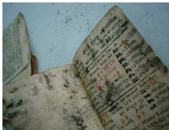
Imagini ale filelor cu atac fungic: pete de mucegai de diferite culori

Mucegaiurile au distrus structura hârtiei, ea devenind fărâmicioasă, moale, poroasă; pe de altă parte, prin metabolismul lor, au pătat hârtia definitiv, iar enzimele produse nu pot fi îndepărtate din hârtie. 2 Petele de culori diferite (galben, maroniu, negru, roșiatic) indică prezența unor specii diferite. Miceliile coloniilor de funghi au dus la lipirea filelor între ele, uneori formând chiar blocuri de grosimea unor fascicoli.