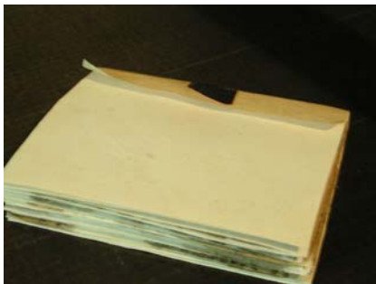
Fascicolele completate, înainte de copertare, învelitor intermediar