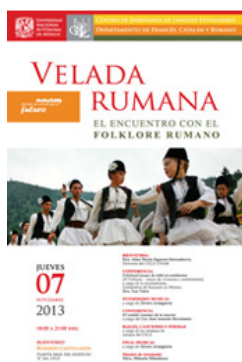
La rencontre avec le folklore roumain

Les soirées sont des situations de communication qui favorisent une approche plus directe aux diverses expressions de la langue et la culture roumaine: littérature, art, philosophie, sculpture, théâtre, traditions, musique, gastronomie.