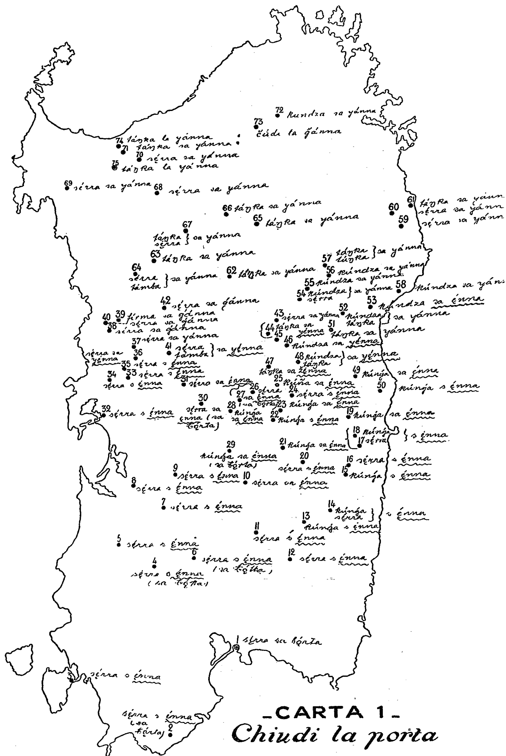
- CARTA 1 - Chiudi la porta