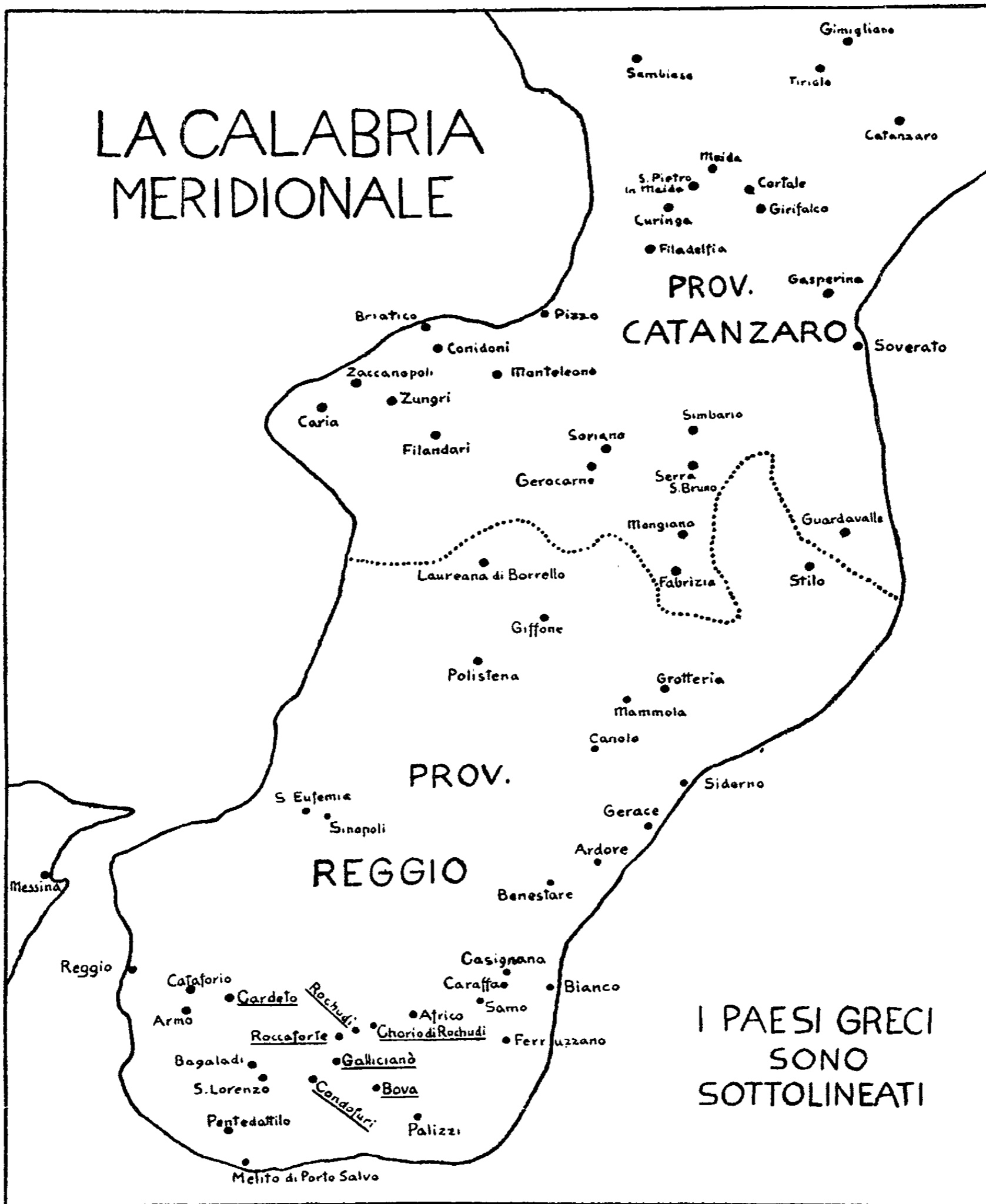
(Da G. Rohlfs, La terminologia pastorale dei Greci di Bova , RLiR, II, p. 294).