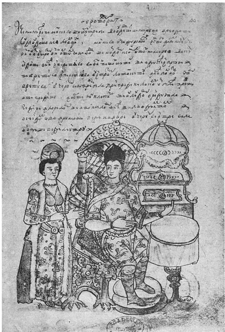
Ilustrațiune din Ms. A. al NOULUI EROTOCRIT.