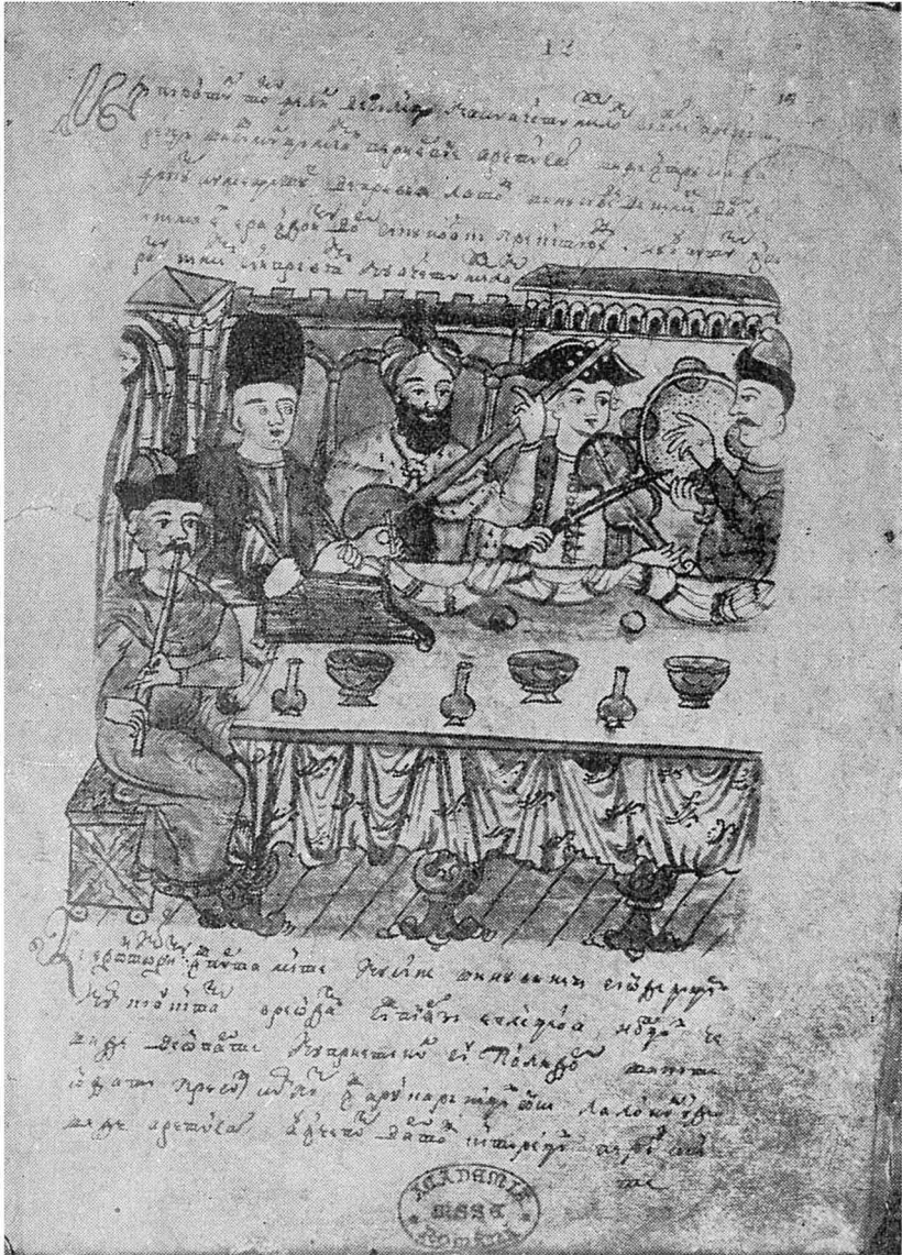
Ilustrațiune din Ms. A. al NOULUI EROTOCRIT.