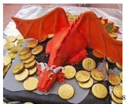
Liebe Sünde, Schokoladenkuchen