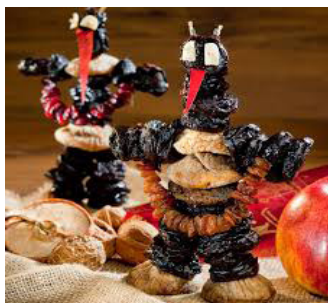
Pflamentoffel (Teufel) (Deutschland, Österreich)

„Im Sakralen liegt daher zunächst keine Garantie für Dauer, für Verehrung, für Tradition, und wenn es zur Tradition wird, ist dies schon der erste Schritt zur Auflösung seiner Sakralität .“ 26 – schreibt Luhmann.