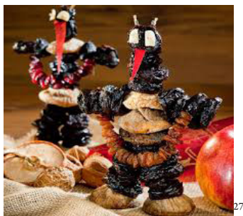
Pflamentoffel ( Teufel ) (Deutschland, Österreich)

„Im Sakralen liegt daher zunächst keine Garantie für Dauer, für Verehrung, für Tradition, und wenn es zur Tradition wird, ist dies schon der erste Schritt zur Auflösung seiner Sakralität .“ 26 – schreibt Luhmann.