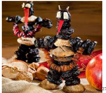
Pflamentoffel ( Teufel ) (Deutschland, Österreich)

„Im Sakralen liegt daher zunächst keine Garantie für Dauer, für Verehrung, für Tradition, und wenn es zur Tradition wird, ist dies schon der erste Schritt zur Auflösung seiner Sakralität .“ 26 – schreibt Luhmann.