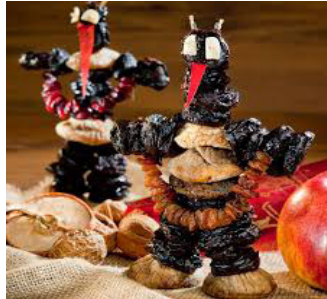
Pflamentoffel ( Teufel ) (Deutschland, Österreich)

„Im Sakralen liegt daher zunächst keine Garantie für Dauer, für Verehrung, für Tradition, und wenn es zur Tradition wird, ist dies schon der erste Schritt zur Auflösung seiner Sakralität .“ 26 – schreibt Luhmann.