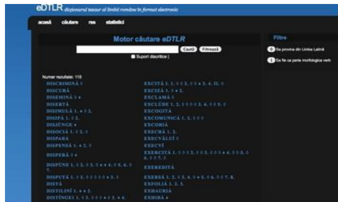
Figura 1: Interfața eDTLR

DTLR are o structură semantică arborescentă, asemănătoare cu schema unui text discursiv. Este foarte importantă conceperea sensurilor cuvintelor ca pe niște relații de incluziune a subsensurilor și a unităților mai mici, sensuri figurate, expresii, sintagme, locuțiuni.