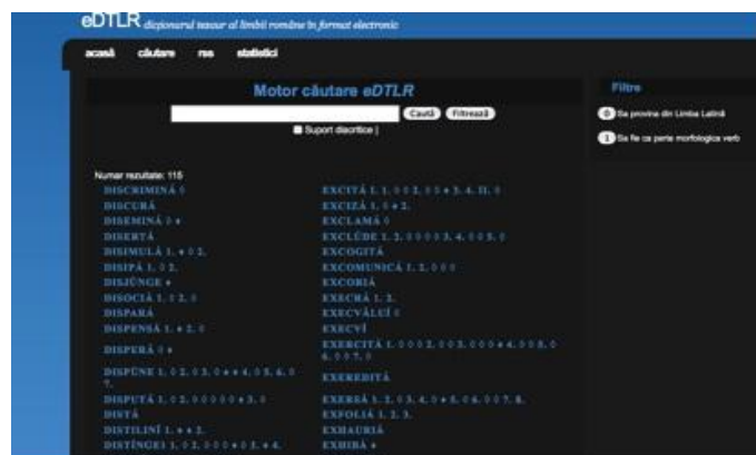
Figura 1: Interfața eDTLR

DTLR are o structură semantică arborescentă, asemănătoare cu schema unui text discursiv. Este foarte importantă conceperea sensurilor cuvintelor ca pe niște relații de incluziune a subsensurilor și a unităților mai mici, sensuri figurate, expresii, sintagme, locuțiuni.