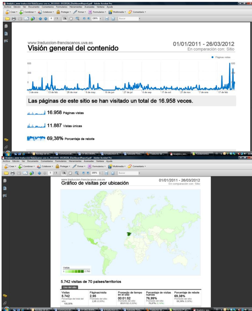
Illustration du nombre d'utilisateurs du site web du projet et des visites par régions mondiales.

montrant ses avancées à travers internet, a été suivi par des milliers de chercheurs du monde entier (5.742 visites dans 70 pays).