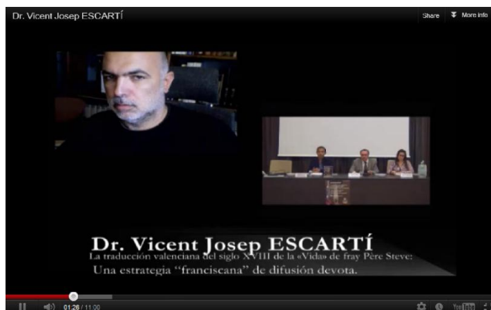
Illustration d'une connexion de vidéoconférence dans le colloque.

Le web nous rapproche du monde, certes, et nous rapproche également des langues et des cultures ; par son entremise tout est vu de plus près. L'éducation se ressent de cette proximité et trouve de nouvelles formules de coopération et de collaboration.