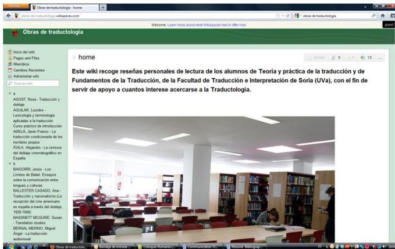
Illustration de la première page du wiki « Obras de traductología »

Les ouvrages contenus dans le wiki (presque trois cent à l'heure actuelle) peuvent être consultées sur la colonne de gauche de l'écran en cliquant sur leur nom d'auteur. Si la langue majoritaire de rédaction est l'espagnol, on compte aussi parfois d'autres, élaborés par des étudiants étrangers. Les ouvrages notés sont d'une grande diversité, recouvrant l'histoire de la traduction dans toutes les époques, la théorie de la traduction ainsi que les différents problèmes traductologiques et professionnels (la formation des traducteurs-interprètes, la traduction audiovisuelle, l'interprétation, la traduction judiciaire, économique, etc.). Le wiki « Obras de traductología » (Œuvres de traductologie) est placé dans les premières positions de Google.