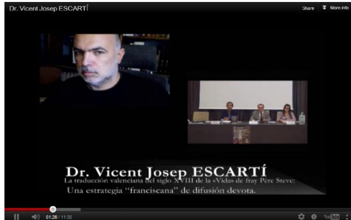
Illustration d'une connexion de vidéoconférence dans le colloque.

Le web nous rapproche du monde, certes, et nous rapproche également des langues et des cultures ; par son entremise tout est vu de plus près. L'éducation se ressent de cette proximité et trouve de nouvelles formules de coopération et de collaboration.