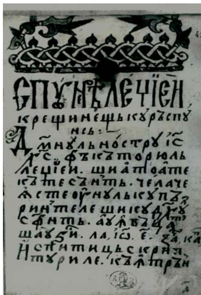
Fig. 2. Filă din ms. rom. 4818 (BAR), copiat de Popa Mihai, supranumit „Românul”.