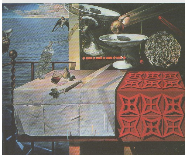
Nature morte vivante, 1956 Huile sur toile 125 x 160 cm. Morse Charitable Trust en prêt au Salvador Dali Museum St Petersburg, Floride.