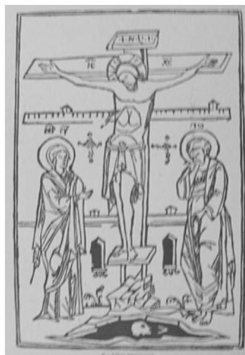
Fig. 2. Triodul-Penticostar, 1558.

P. Binder, Contribuții la cunoașterea vieții și activității diacului Lorinț , în „Studii de limbă literară și filologie”, II, 1972, p. 255–256, iar, cu referire la ediția cracoviană, Ion-Radu Mircea, Primele tipărituri chirilice și incunabulul cracovian de la Brașov , în Târgoviște, cetate a culturii românești , Partea I, Studii și cercetări de bibliofilie , București, 1974, p. 118 și p. 122.