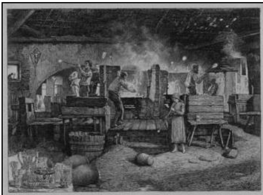
Fabrica de sticlă din Bachergebirge/Pohorje.

Declinul producției la fabrica de sticlă de la Crasna a început de prin anii 1812–1814. Treptat, între anii 1814 și 1817, din cauza tăierii complete și arderii pădurilor din jurul ei și a dificultăților privind transportul lemnului de la distanțe mari, fabrica și-a redus activitatea, pentru ca, în anul 1817, aceasta să fie sistată definitiv.