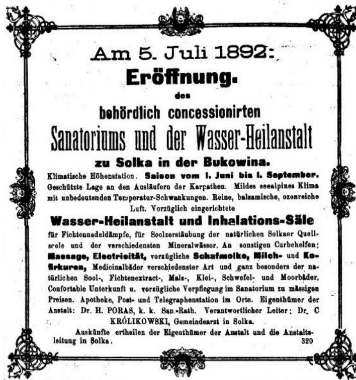
Anunț publicitar, în „Bukowinaer Rundschau”, Czernowitz, XI. Jahrgang, Nr. 1157, Dienstag den 5. Juli 1892, p. 4.