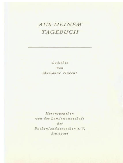
Pagina de gardă a volumului Aus meinem Tagebuch