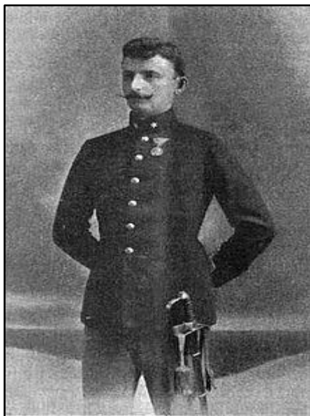
Heinrich Kipper în anul 1915