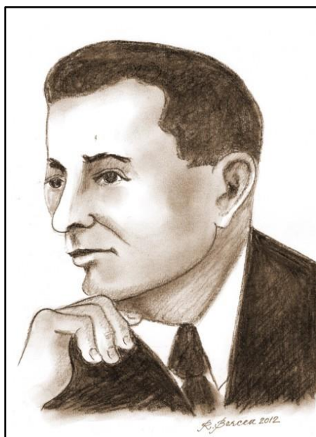
Heinrich Kipper văzut de Radu Bercea, 2012