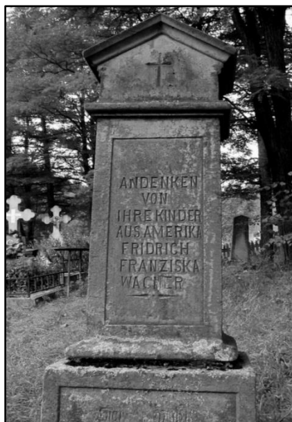
Foto 2. Gedenk-Grabstein. Eisenauer Friedhof

Der Niedergang des Bergbauwesens in diesem südlichen Buchenländer Bergland, der später große Kinderreichtum in dieser Gegend und die allgemeine Wirtschaftslage führten um 1900 auch hier zu Abwanderungen, vor allem über die Berge Richtung Siebenbürgen (vor allem in den Bistritz-Nassoder Raum) mit seinen evangelischen Sachsen, Raum, aus dem seinerzeit Siedler in die evangelischen Zipser-Siedlungen gekommen waren, aber auch nach Nordamerika 19 .