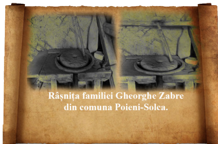
Fig. 1. Râșniță din comuna Poieni-Solca.