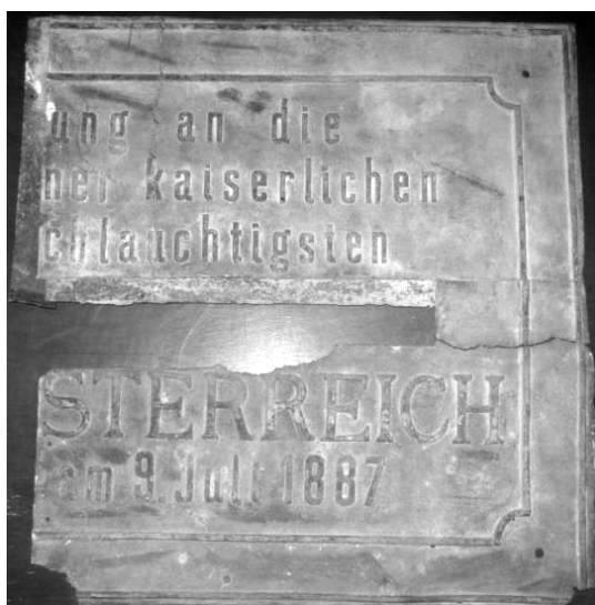
Foto 1. Inscripția comemorativă de pe placa frontală.

Soclul (Foto. 3), cu înălțimea de 2,10 m, este format din patru postamente pătrate, de dimensiuni diferite, suprapuse piramidal. Pe laturile celei de a treia componente a soclului (1,50 × 0,90 m) este săpată câte o nișă cu dimensiunile de 1,10 × 0,60 × 0,05 m. În nișa de pe fața sudică, cea dinspre șosea, a fost amplasată o placă făcută din plumb, cu dimensiunile de 1,10 × 0,60 m, pe care a fost înscris, cu litere în relief, aurite, un text menit să amintească de vizita prințului moștenitor Rudolf al Austriei (Foto. 1).