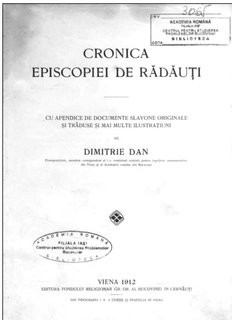
Coperta ediției princeps a lucrării Cronica Episcopiei de Rădăuți , Viena, 1912.

imperativul romantic al „etnografiei de urgență”: „să scap mai multe fapte din brațele uitării și să le păstrez pentru generațiile viitoare” 39 . De aceea, când cunoscutul jurnalist, scriitor și om de televiziune Vartan Arachelian „a recuperat” o traducere românească (în manuscris) a acestei lucrări datorate cărturarului bucovinean, el a oferit-o spre tipărire unei edituri din București. Astfel, după varianta românească din 1891, o nouă ediție a lucrării a apărut în anul 2010, cu titlul Armenii ortodocși