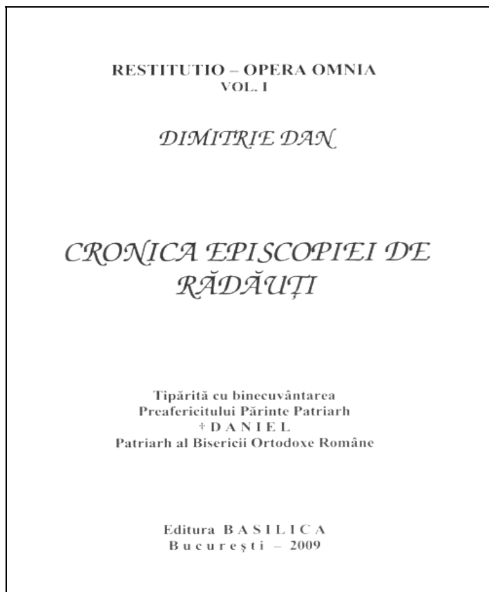
Coperta ediției a II-a a lucrării Cronica Episcopiei de Rădăuți , București, 2009.

din Bucovina 40 . Necesitatea retipăririi traducerii a fost argumentată și prin faptul că se înscrie printre „puținele lucrări dedicate, în spațiul de limbă română, armenilor și istoriei lor, în special cele referitoare la armenii trăitori în spațiul istoric și cultural românesc” 41 . Traducătorul nu a fost identificat – rămâne doar o presupunere că ar fi Boris Goilav –, dar redactorul volumului, bazându-se pe notele inserate în textul lucrării de traducător, susține că „putem afirma cu certitudine că este vorba de o traducere făcută la peste trei decenii față de anul în care Dimitrie Dan și-a semnat Prefața : «Jujineț, în iunie 1890»” 42 .