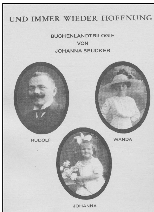
Coperta volumului Und immer wieder Hoffnung. Eine Buchenlandtrilogie, München, 1984.