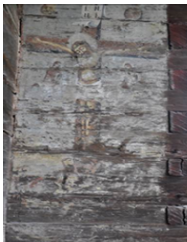
„Răstignirea” – absida sudică a peretelui naosului.

Din cauză că icoanele se află la exterior, fiind supuse în mod direct razelor solare, uneori ajungând pe suprafața lor și apa de ploaie, pierderile stratului pictural sunt foarte însemnate. Trebuie menționat și faptul că sunt pictate pe bârnă, iar lemnul, având higroscopicitate mare (se umflă și se contractează), pierderile stratului pictural sunt accelerate.