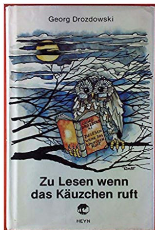
Coperta volumului de povestiri Zu lesen wenn Das Käuzchen ruft. Erzählungen , Klagenfurt, Editura Heyn, 1985.