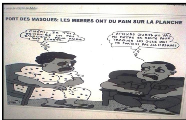
IMAGE 4 : La Nouvelle Expression , N° 5206 du mardi 22 avril 2020, p.12

Le caricaturiste s'attache à exposer les malaises sociaux, à enclencher des réactions pathémiques chez une cible : puisque la communication est toujours destinée à une instance de réception. Dans cet axe du travail, nous avons choisi, comme objet d'analyse, les conceptions sur la pandémie de coronavirus et ses effets sur la vie socio-professionnelle. Ainsi, il n'est pas question de recourir exclusivement aux signes non linguistiques mais aux messages linguistiques qui gouvernent la construction des sens.