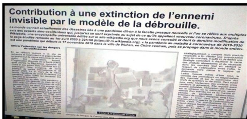
IMAGE 2 : La Nouvelle Expression , N° 5229 du lundi 02 juin 2020, p.10

L'image encadrée par les signifiés ne laisse pas voir la réelle identité des référents présentés en filigrane. Il y a là, une mise en œuvre de l'abstrait ou de l'insaisissable. La matérialisation de cette abstraction est renforcée par la titraille : « Contribution à une extinction de l'ennemi invisible 2 par le mode de la débrouille ». Il existe un rapport d'analogie entre le signe linguistique, « ennemi invisible », et l'image, de par son apparence floue. Le signifié métaphorise le COVID-19 et son caractère dévastateur.