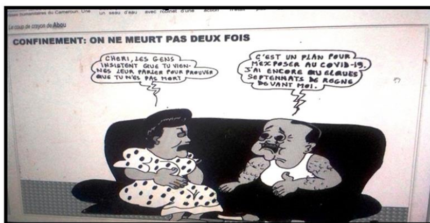
IMAGE 5 : La Nouvelle Expression , N° 5204 du vendredi 17 avril 2020, p.11

En observant certaines réalisations, nous constatons un entremêlement entre le social et le politique. La crise sanitaire partage dès lors maison commune avec l'activité politique. Ce double langage est concrétisé dans l'image 5 ci-dessous :