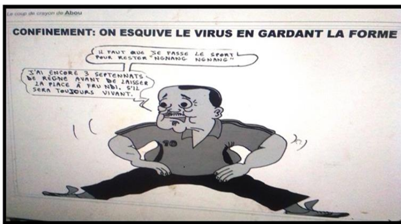
IMAGE 1 : La Nouvelle Expression , N° 5207 du jeudi 23 avril 2020, p.11

L'image ci-dessous exacerbe les traits physiques du Président de la République du Cameroun, Paul Biya, et le positionne dans une posture d'avare.