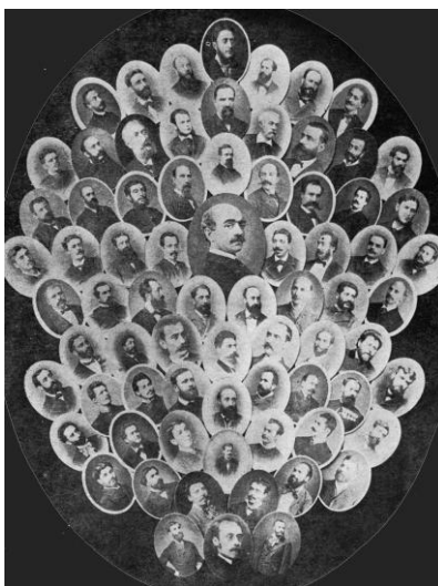
Foto: Vasile Pogor, Titu Maiorescu, Iacob Negruzzi, portret colectiv al Societații Junimea (1883)