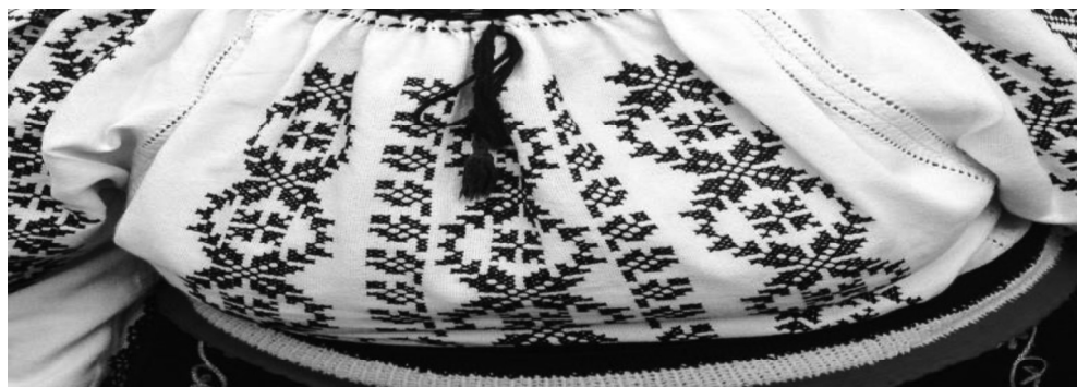
1. Symboles sur les vêtements traditionnels roumains.

le Diable sont absents, ce qui préfigure un Paradis retrouvé. Sensible aux valeurs esthétiques de l'Orient, qu'il découvre dans le classicisme français d'Ingres et dans le romantisme sensitif de Delacroix, Théodore Aman introduit la thématique orientale, mais, à la différence des peintres de l'Europe occidentale, il se souvient des traditions orientales assimilées par la culture roumaine.