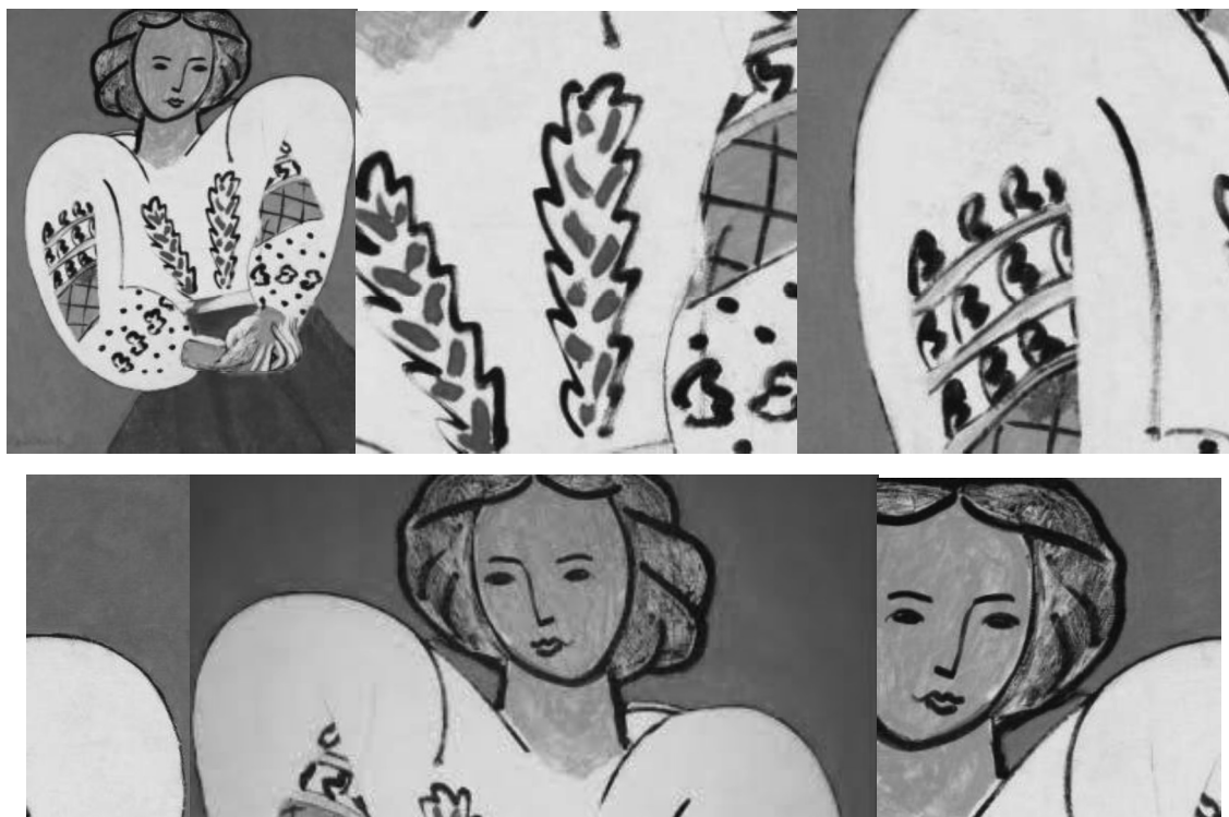
4. La Blouse roumaine – détails.

L'amitié et l'œuvre des deux grands peintres représente un exemple éloquent de cultures croisées.