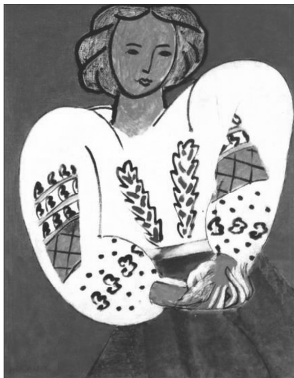
3. L'œuvre La Blouse roumaine . Source : https://www.wikiart.org/en/henri-matisse/the-rumanian-blouse-1940 ).

son tour, Gheorghe Tattarescu (1820-1894), peintre du mouvement néoclassique et membre actif de la révolution de 1848, utilise lui aussi la blouse roumaine pour une représentation allégorique et idyllique de l'identité nationale. Le registre rural idyllique et le thème de la blouse roumaine fascinent bien des peintres de la deuxième moitié du XIXe siècle jusqu'à la période de l'entre deux guerres.