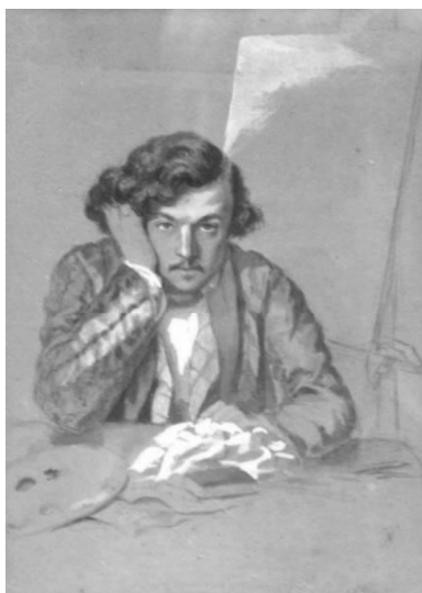
5. Theodor Aman (1831-1891) – Autoportrait (1851).

Après la mort de Gustave Moreau, Pallady continue ses études dans le même atelier avec Aimé Morot et ensuite avec Fernand Cormont. En 1900 il participe pour la première fois au Salon et à l'Exposition Universelle de Paris et, à partir de 1906, il installe à Paris son atelier pour une trentaine d'années, en revenant périodiquement à Bucarest pour Le Salon Officiel (1909, 1924, 1926, 1927, 1933-1937), ou pour des expositions personnelles (1904, 1923, 1929, 1931, 1933, 1935, 1937, 1940, 1942). La correspondance entre Matisse et Pallady est extrêmement intéressante par le ton sincère et parfois plein d'humour. "Je suis déçu que tu aies accepté d'illustrer, de dessiner les bêtises de Tzara", écrivait Pallady à Matisse dans une lettre. De ces lettres qu'ils se sont envoyés l'un l'autre on comprend qu'à l'époque Matisse se trouvait dans une situation privilégiée. En France, il habitait à Nice, donc au bord de la Côte D'Azur, il jouissait de toutes les conditions, tandis que Pallady se sentait déprimé, prisonnier dans son propre pays.