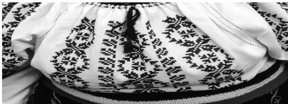
1. Symboles sur les vêtements traditionnels roumains.

le Diable sont absents, ce qui préfigure un Paradis retrouvé. Sensible aux valeurs esthétiques de l'Orient, qu'il découvre dans le classicisme français d'Ingres et dans le romantisme sensitif de Delacroix, Théodore Aman introduit la thématique orientale, mais, à la différence des peintres de l'Europe occidentale, il se souvient des traditions orientales assimilées par la culture roumaine.