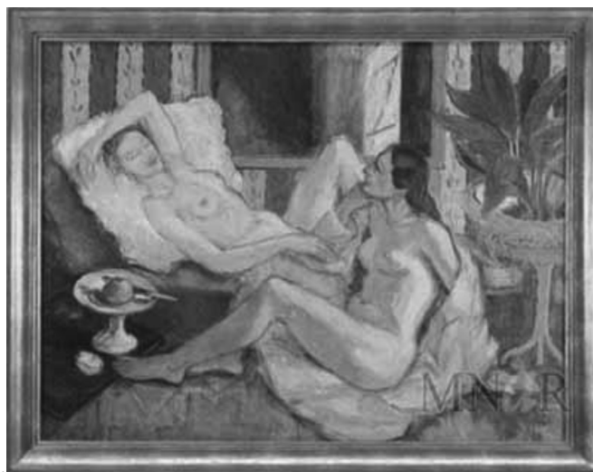
7. Toujours du Baudelaire , Theodor Pallady.

D'ailleurs, Baudelaire lui-même a reconnu à maintes reprises que son univers est jusqu'à un point l'univers de Matisse et de Pallady, car les deux sont, chacun de son côté, des poètes du pinceau. A son tour, Pallady a créé la toile Toujours du Baudelaire .