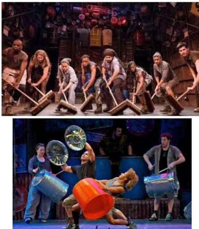
Stomp – imagini din spectacol, Las Vegas, S.U.A.

Grupul Sistem a reușit cu brio fuziunea între convențional și neconvențional prin îmbinarea elementelor de ritmică tradițională europeană, cu cele aparținând altor culturi, în speță sud-americane, africane sau asiatice, folosind instrumente de percuție din ambele sfere (setul de multipercuție, recipiente din metal, mase plastice, lemn, precum și unelte folosite în construcții, de pildă polizorul unghiular). De asemenea, grupul a promovat tipul de artă scenică propusă de predecesorii Stomp sau Blue Man Group , definind conceptul de actor-percuționist, un artist complet, pregătit pentru un altfel de spectacol, deosebit de admirat de public.