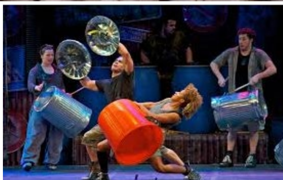
Stomp – imagini din spectacol, Las Vegas, S.U.A.

Grupul Sistem a reușit cu brio fuziunea între convențional și neconvențional prin îmbinarea elementelor de ritmică tradițională europeană, cu cele aparținând altor culturi, în speță sud-americane, africane sau asiatice, folosind instrumente de percuție din ambele sfere (setul de multipercuție, recipiente din metal, mase plastice, lemn, precum și unelte folosite în construcții, de pildă polizorul unghiular). De asemenea, grupul a promovat tipul de artă scenică propusă de predecesorii Stomp sau Blue Man Group , definind conceptul de actor-percuționist, un artist complet, pregătit pentru un altfel de spectacol, deosebit de admirat de public.