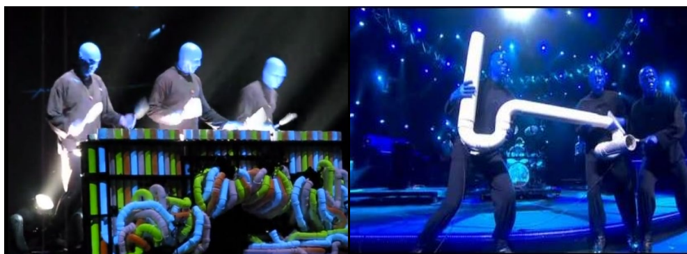
Blue Man Group – imagini din timpul spectacolului din Las Vegas, S.U.A.

Sfârșitul anilor '80 și începutul anilor '90, găsește două grupuri de artiști, care reușesc cu succes să introducă un nou tip de artă scenică, combinând teatrul cu percuția neconvențională, pantomima, decorurile futuriste, sunet, lumini și efecte speciale ale vocii, realizând astfel un sincretism al artelor. Este vorba despre grupurile Blue Man Group din S.U.A și Stomp, din Marea Britanie. Principala diferență acustică dintre cele două grupuri constă în utilizarea de către Blue Man Group a unor instrumente special create de artiștii înșiși, pe când Stomp recurge la transformarea unor obiecte în instrumente de percuție. Bineînțeles și tipul de spectacol realizat de cele două grupuri prezintă diferențe.