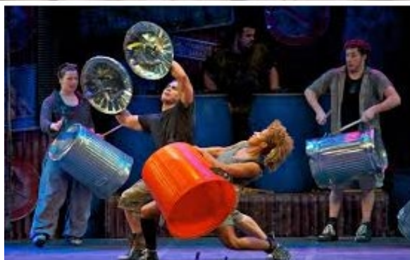
Stomp – imagini din spectacol, Las Vegas, S.U.A.

Grupul Sistem a reușit cu brio fuziunea între convențional și neconvențional prin îmbinarea elementelor de ritmică tradițională europeană, cu cele aparținând altor culturi, în speță sud-americane, africane sau asiatice, folosind instrumente de percuție din ambele sfere (setul de multipercuție, recipiente din metal, mase plastice, lemn, precum și unelte folosite în construcții, de pildă polizorul unghiular). De asemenea, grupul a promovat tipul de artă scenică propusă de predecesorii Stomp sau Blue Man Group , definind conceptul de actor-percuționist, un artist complet, pregătit pentru un altfel de spectacol, deosebit de admirat de public.