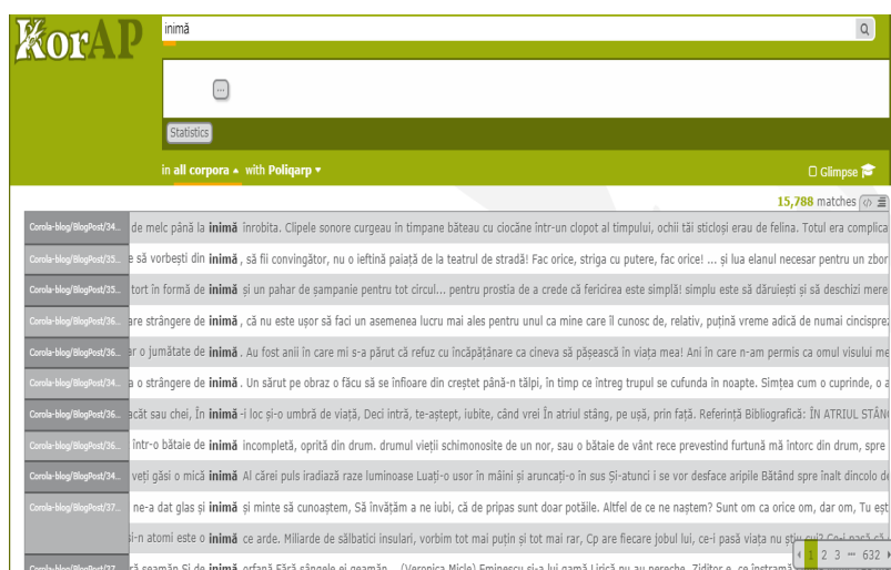
Fig. 1. Inimă : e-ocurențe

propoziții-eșantion, dispuse pe 632 de pagini. Se pot extrage referințele bibliografice și nu numai (cf. metadata-standard: autor, data publicării, editură, genul literar al textului etc.), referitoare la un anumit eșantion ce se dorește a fi selectat.