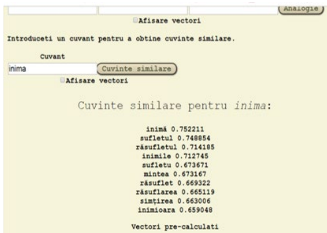
Fig. 3. Inimă : e-sinonime și e-cuvinte similare

La selectarea butonului pentru a identifica lexemele similare, analogice pentru cuvântul „inimă” ( http://89.38.230.23/word_embeddings/index.php?similarity_w=inima&do=similarity ), apar: