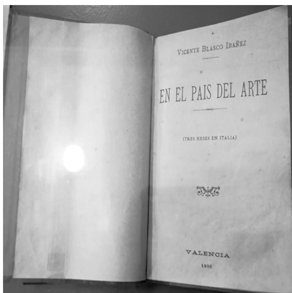
Figura 1. Edizione originale del 1896 probabilmente edita dallo stesso Blasco Ibanez a Valencia. Attualmente conservata presso la “Casa-museo Blasco Ibáñez”.