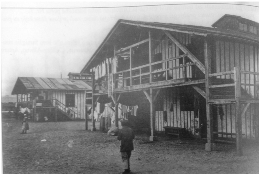
Figura 2. Una baracca nel campo di Wagna.

e i nde iò tignù fermi na dì nte na baraca arento la stasion del treno. Poi cu iera na serto ora de noto ze vignù tanti cari cui manzi che i nde iò fato zì n zora e npo de fameiei i ndò menà per ogni vilagio. A mi mi veva tocà da zì ntele scule a Kemer [Camar, Romania, distretto di Salaj] e là i nde iò tignù dai tre de zugno fina ai dodize de otobre, perché iera meso n guera la Rumenia n contro l Austria. E cusì anca sta volta i nde iò menà cui cari fina n stasion a Szilasomio che poi na ora prima de noto i nde iò fato zì n treno e i ndo menà fina n Boemia. Per viazo i ndo dà da magnà a Gior [Gyor] n Ungaria e a Praga, poi là i iò destacà i vagoni e noi i ndo menà a Königinhof e altri i li iò menadi sa e là per la Boemia. Cu signemo rivadi n sta cità i ndo meso nten grandando baracon. Là vemo catà anca Tirolesi, fati scanpà anca iei da le so case colpa la guera. Poi alora via de sto baracon i ndo meso per le case dei privati n afito, e a laorà per le fabriche. Poi, ai dodize de genaro 1917 mi sen zì soldà e la zento no ze vignudi a Vale fina i primi mesi del 1918”.