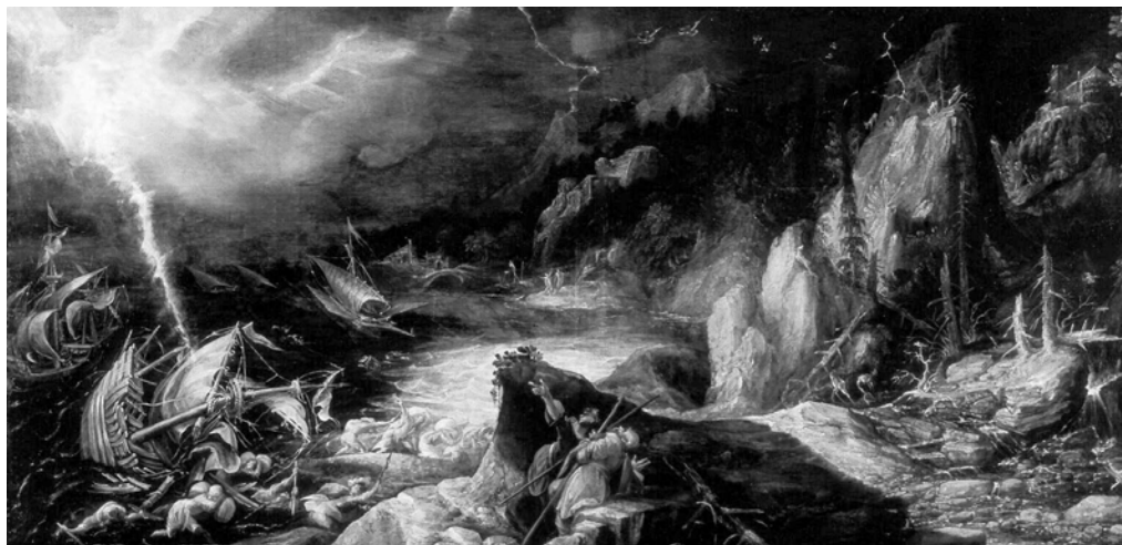
Frederik van Valckenborch, Peisaj cu scene din Eneida vergiliană , 1603

Ithacae, Laertia regna, / Et terram altricem saevi exsecramur Ulixi. / Mox et Leucatae nimbosa cacumina montis / Et formidatus nautis aperitur Apollo ( Aen. , III, 268-275) „Iar noi gonim pe înspumata mare/ Pe unde, priincios, ne-ndreaptă vântul/ Și Palinur, cârmaciul nostru. Iată,/ Din toiul valurilor se ivește/ Împădurita insulă Zacintos,/ Dulichiu, și Same, și Neritos,/ Ostróvul cel cu înălțimi pietroase./ Scăpăm de stâncăriile Itacâi,/ De țara lui Laerte, blăstămând-o,/ Că ea doar l-a hrănit pe nemilosul/ Ulise. Dup-aceea ni s-arată/ În neguri, vârful muntelui Leucate/ Și templul lui Apolo, cel de care/ Se tem corăbierii” (trad. G.I.T., p. 143).