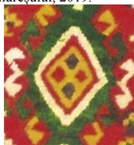
Foto 14: Detaliu pe țol/covor. Romb cu coarne Colecția Muzeului de Etnografie din de la Ieud, Maramureșul Voievodal, 2019.