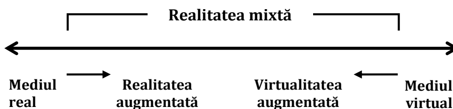
Fig. 2. Continuumul realitate-virtualitate al lui Milgram 6

Paul Milgram și Fumio Kishino propun conceptul de „continuum realitate-virtualitate” 4 (Fig. 2), care s-ar plasa undeva între mediul real și mediul virtual, incluzând „realitatea augmentată” (Augmented Reality - AR) și „virtualitatea augmentată” (Augmented Virtuality - AV), prima situându-se în vecinătatea lumii reale, în timp ce, cea de a doua, este mai aproape de mediul virtual 5 . Așadar, realitatea augmentată este un hibrid între reproducerea tridimensională a lumii, pe de o parte, și conținuturi virtuale menite să aducă lumii „completări”, pe de altă parte.