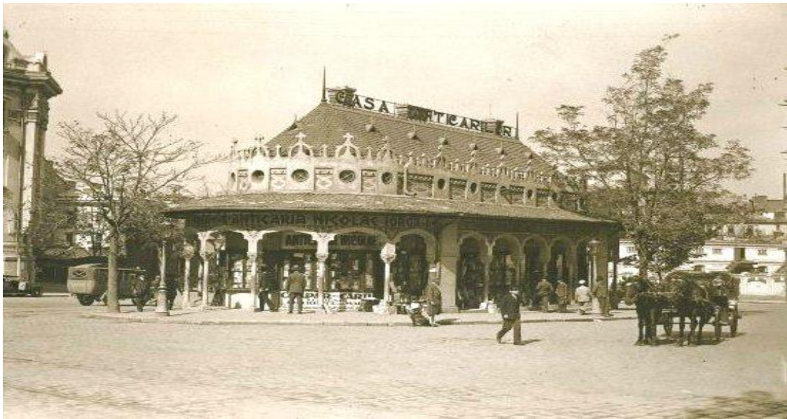
Fig. 1. Casa Anticarilor – vedere frontală 8 .