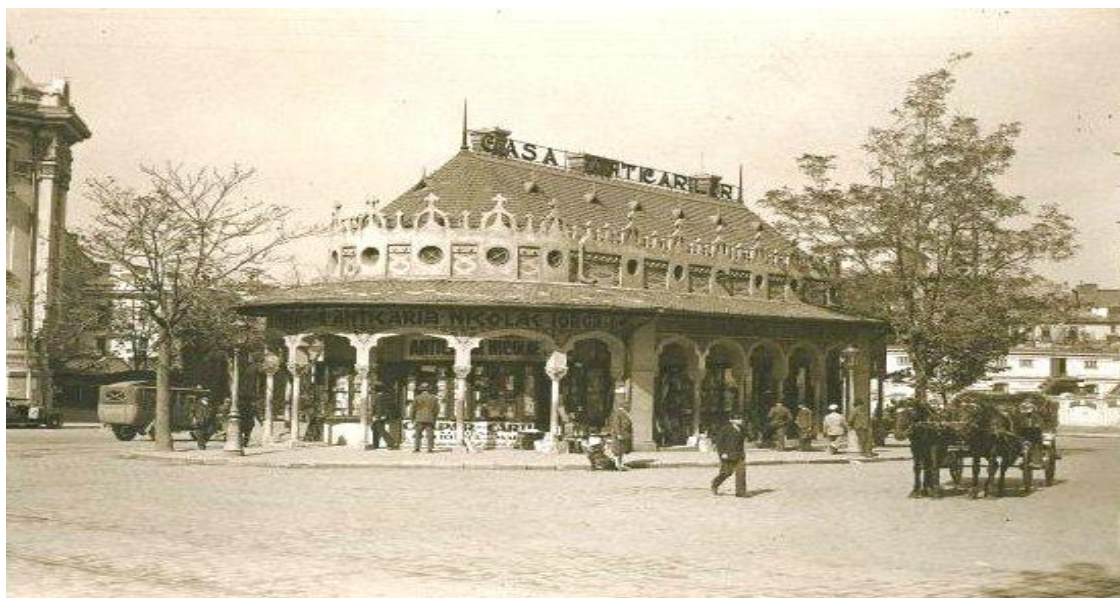
Fig. 1. Casa Anticarilor – vedere frontală 8 .