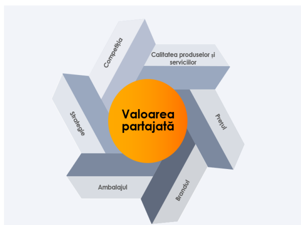
Figura 2 – Factori endogeni