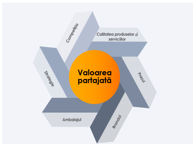
Figura 2 – Factori endogeni