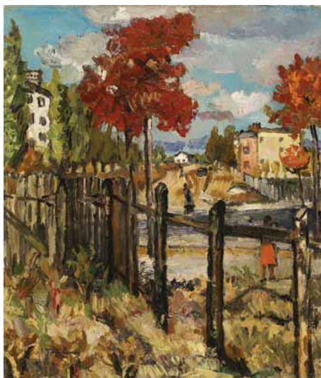
Fig. 1. Ion Țuculescu, Peisaj , ulei pe pânză, 54,5 x 46,5 cm, semnat stg. jos I. Țuculescu, [1935-1937]

fugă, pentru ca al doilea punct de fugă să fie pe linia mediană a tabloului, prins în mica construcție din fundal, accentuată de albul luminos. Partea de orizontale e contracarată, în echilibru, de verticalele pe două nivele: unul al verticalelor scurte create de scândurile gardului și al doilea, de clădiri care flanchează compoziția și de cei doi copaci cu frunzișul de un roșu pregnant. Lucrarea relevă o fază cadrată încă în sfera căutărilor, a definirii stilului de mai târziu.