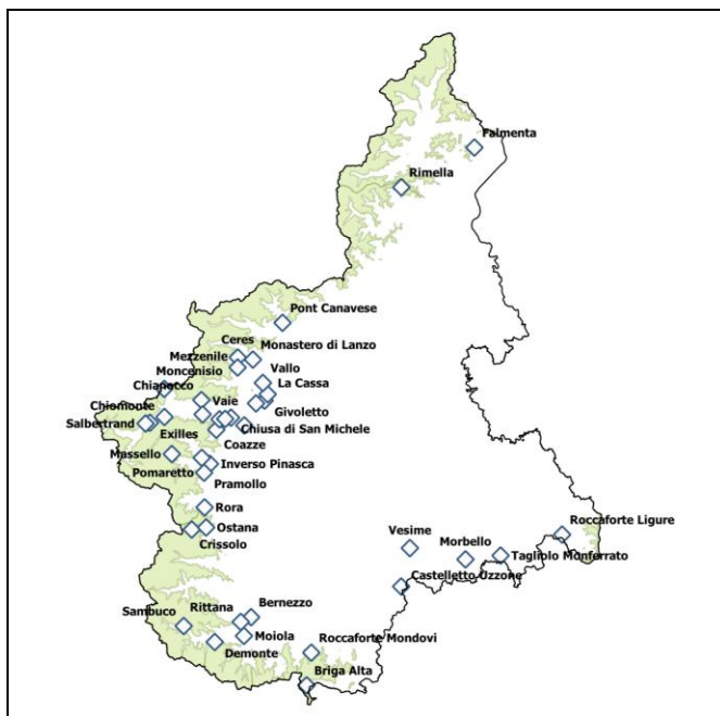
Fig. 3. Mappa delle località che presentano attestazioni toponimiche collegate all'attività carbonifera