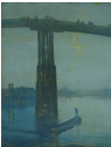
Whistler - «Nocturne en bleu et or»

C'est Whistler, qui découvre dans ses Nocturnes , « arrangements en gris et argent, » « en bleu et or » « en bleu et argent », « en opale et argent, » « en gris et or, » toute une série d'harmonies nouvelles formées par la nuit.