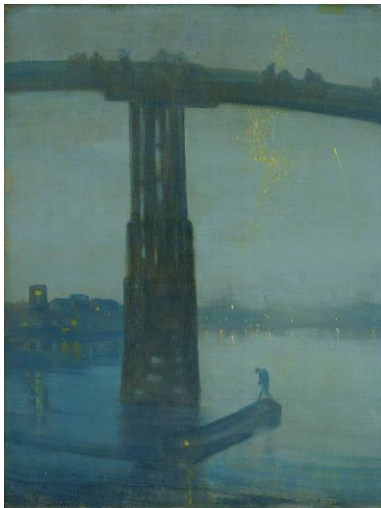
Whistler - «Nocturne en bleu et or»

C'est Whistler, qui découvre dans ses Nocturnes , « arrangements en gris et argent, » « en bleu et or » « en bleu et argent », « en opale et argent, » « en gris et or, » toute une série d'harmonies nouvelles formées par la nuit.