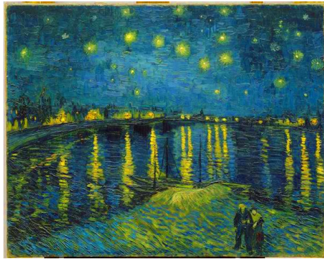
Vincent van Gogh, La nuit étoilée

La Poésie se déploie pendant que «le soleil a cédé l'empire à la pâle reine des nuits» (Lamartine). Le même paysage, traversé avant et après le coucher du soleil, n'a pas seulement un autre éclairage – mais il a une autre perspective et une autre atmosphère dans l'espace illimité. Le ciel n'est plus un plafond, mais c'est une coupole. Toutes les proportions (se) changent. La nuit devient une grande porteuse et faiseuse de synthèses. Les Esprits de la Nuit tournent autour de l'obscurité. Les ombres ne sont plus solides, mais mouvantes et instables. Les ondes de la lune glissent sur les pentes des toits, trouent les dômes de feuillage et filtrent à travers les taillis.