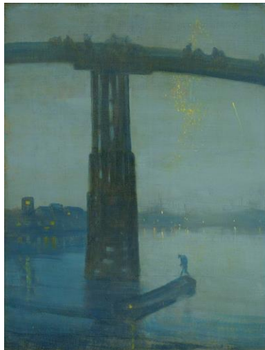
Whistler - «Nocturne en bleu et or»

C'est Whistler, qui découvre dans ses Nocturnes , « arrangements en gris et argent , » « en bleu et or » « en bleu et argent », « en opale et argent , » « en gris et or , » toute une série d'harmonies nouvelles formées par la nuit.