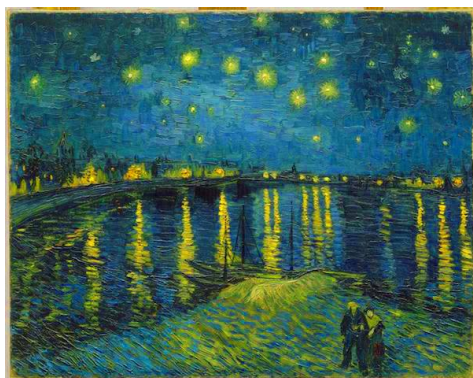
Vincent van Gogh, La nuit étoilée

La Poésie se déploie pendant que »le soleil a cédé l'empire à la pâle reine des nuits« (Lamartine). Le même paysage, traversé avant et après le coucher du soleil, n'a pas seulement un autre éclairage – mais il a une autre perspective et une autre atmosphère dans l'espace illimité. Le ciel n'est plus un plafond, mais c'est une coupole. Toutes les proportions (se) changent. La nuit devient une grande porteuse et faiseuse de synthèses. Les Esprits de la Nuit tournent autour de l'obscurité. Les ombres ne sont plus solides, mais mouvantes et instables. Les ondes de la lune glissent sur les pentes des toits, trouent les dômes de feuillage et filtrent à travers les taillis.