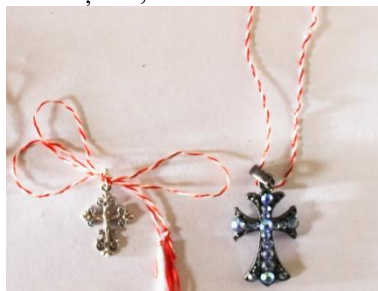
Foto 15a: Cruce creștină aninată de șnurul mărtișorului, Arhivă personală, Maramureș, 2018.