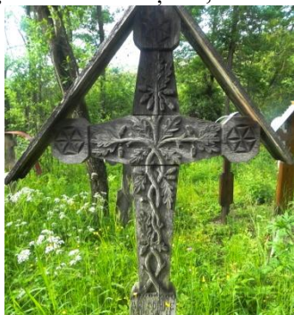
Foto 3: Cruce de lemn cu simbol dendromorf, Cimitirul vechi din Breb, Țara Maramureșului, 2018.