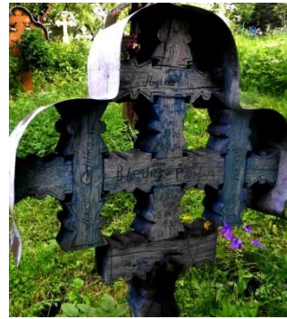
Foto 6: Cruce de lemn cu brațe „vălurite” [ondulate], Cimitirul vechi din Breb, Țara Maramureșului, 2018.