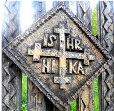
Foto 11: Detaliu. Crucea creștină și slove sacre pe poartă tradițională, Breb, Țara Maramureșului, 2018.