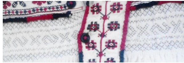
Foto 12: Detaliu. Crucea Sf. Andrei pe un spăcel din Țara Codrului, Colecția Muzeului Județean de Etnografie și Artă Populară din Baia Mare, Maramureș, 2018.