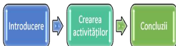
Figura 1. Etapele unui Subject Sampler.

La realizarea unui Subject Sampler se parcurg următoarele etape (figura 1):