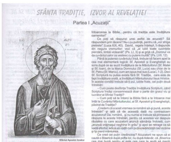
„Sfânta Tradiție, izvor al revelației. Partea întâi Acuzații ”, în Candela , nr. 1-2, ianuarie – februarie 2006.

În imaginea de mai sus observăm din nou, ca și în cazul titlurilor de publicații prezența cu preponderență a substantivelor în titlu. Acest titlul este constituit din trei substantive comune, două în nominativ (tradiție și izvor), unul în genitiv (al revelației) și un adjectiv (sfântă). Prima parte a titlului este izolată prin virgulă de cea de-a doua „izvor al revelației”, care are rol apozitiv, vine ca o explicație și o completare a primei părți.