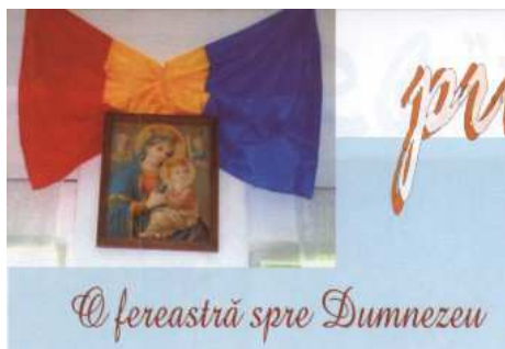
„O fereastră spre Dumnezeu”, în Chemarea Credenței , nr. 153-154, noiembrie – decembrie 2005.

Titlul „O fereastră spre Dumnezeu” este un grup nominal constituit din două substantive „o fereastră” substantiv comun în nominativ, articulat cu articolul nehotărât euclitic „o”, „spre Dumnezeu” – substantiv propriu în acuzativ. Imaginea fotografică anexată titlului arată o icoană cu Maica Domnului și Pruncul, străjuită de un tricolor și poziționată în dreptul unei ferestre, într-o sală de clasă.