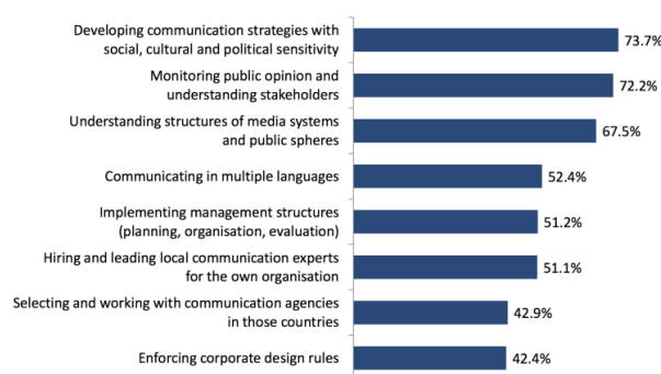
Major challenges of international communication in non-European countries