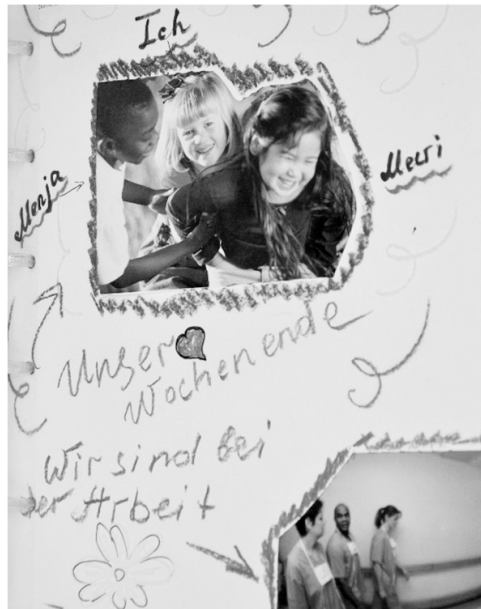
Abb. 2: Spielerisch entsteht eine Text-Bild-Collage

Schreibspiele ermöglichen es, auch mit heiklen Themen zu experimentieren. Hierzu zählen etwa die Kategorien wahr und falsch. Gleichwohl kann aus den Schreibspielen ein Realitätsbezug erwachsen, v. a. dann, wenn zukünftige Handlungsalternativen erprobt oder vergangene Ereignisse seziert und biografisch neu eingeordnet werden. Schreiben als Spiel zu denken kann sich außerdem auch auf das Schriftbild erstrecken. Durch die Verwendung von Farben und Materialien, wie z. B. Ausschnitte aus Zeitschriften, wird der Text selbst zum Bild.