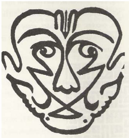
Image 2 : Calligramme formé par les noms des saints xiïtes : Allah, Ali, Mohamed et Hassan.

Le singulier calligramme ci-dessous a aussi été composé utilisant la technique du miroir. Ce travail spécial est composé par la jonction de quatre noms de saints xiïtes : le nom Allah ( ) forme le front, le nom Ali ( ) forme le nez, le mot Mohamed ( ) forme les yeux et la bouche et le nom Hassan ( ) forme le maxillaire. Ces noms, tous stylisés et transformés par le calligraphe, composent un côté de la face qui, doublé, se reflétera sur l'autre côté comme dans un miroir et formeront l'image de la face que nous voyons ci-dessous comme un type d'écho où une face répond à l'autre: