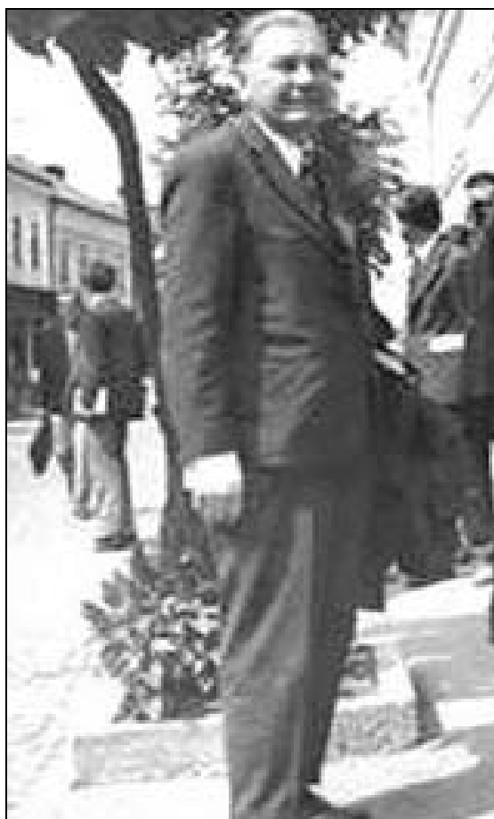
Gheorghe Ivănescu, la începutul anilor 1970.