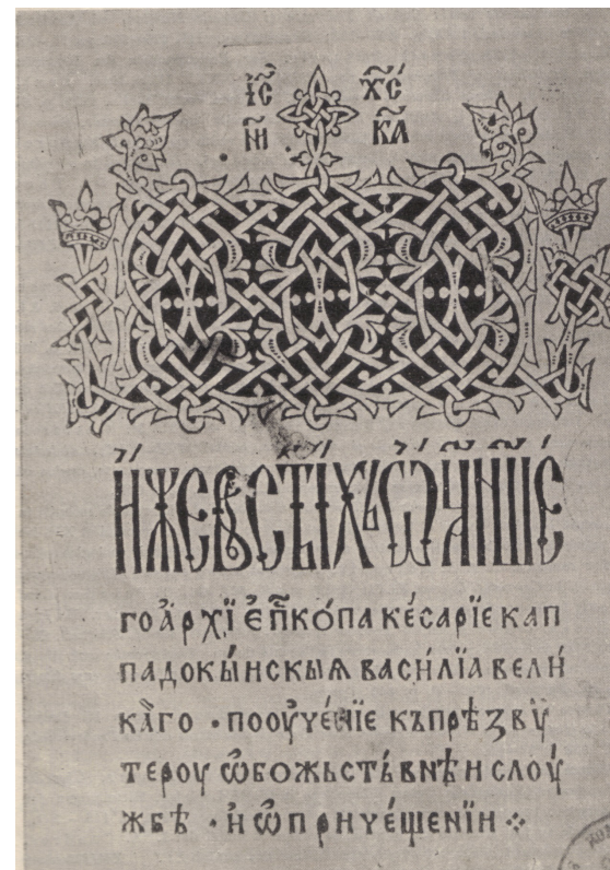
Evangheliarul lui Macarie

Η ΖΕ Β Σ Τ Ι Χ Ω Ν Η Σ ΓΟ ΑΡΧΙ ΕΠΚΟΠΑ ΚΕΣΑΡΙΕ ΚΑΠ ΠΑΔΟΚΥΝΣΚΑ ΒΑΣΗΛΙΑ ΒΕΛΗ ΚΑΓΟ· ΠΟΟΥΕΝΙΕ ΚΖΠΡΕΖΒΥ ΤΕΡΟΥ ΩΒΟΖΒΣΤΕΒΝΕΝ ΣΛΟΥ ΖΕΒ· ΗΩΠΡΗΥΕΨΕΝΙΗ