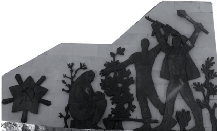
La Nation victorieuse - 1941-1945. Croatie 1991

Que peut-on attendre de l'Europe ? les événements sanglants de Bosnie ont laissé place à l'amertume et à la déception. Les prochains élargissements de l'Union ne sont que des épiphénomènes qui confortent l'indécision et l'absence de Grande Politique. Dans son ouvrage, Après la crise - 2010 , Alain Touraine 2 s'interroge sur le sens de cette crise et surtout comment nous en sortir dans un monde de plus en plus interdépendant.