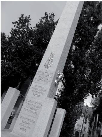
Napoléon. Slovénie © LP - 2008

La crise est donc une épreuve qui se gère si nous avons un projet de société en commun comme le définissait autrefois le grand stratège chinois Sun Tzu dans son traité de l'Art de la guerre. Sun Tzu a dit (17- p. 96) : Tout l'art de la guerre est duperie. (19- p.140) : L'ordre ou le désordre dépendent de l'organisation, le courage ou la lâcheté des circonstances, la force ou la faiblesse des dispositions.