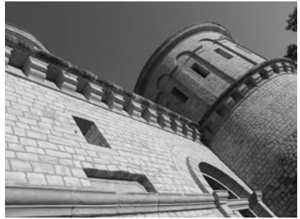
Doc. 3 et 4 Lieu de mémoire : Fort Thüngen Vauban, Architecte militaire Plateau de Kirchberg- Luxembourg , L.P.

Ainsi, plus qu'un simple témoignage historique, les itinéraires culturels sont un extraordinaire vecteur de rassemblement et une chance unique de diffusion de la culture.