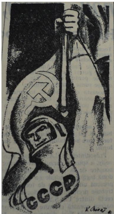
Desen propagandistic înfățișând un cosmonaut ridicând Flamura Victoriei în Cosmos. (Scânteia 7 august 1961)