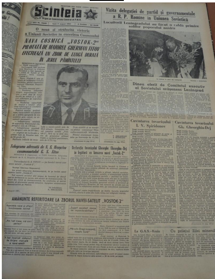
Fig. 4: Prima pagină a oficiosului bucureștean din data de 7 august 1961. Așa cum se poate observa, această primă pagină e împărțită între zborul încă în desfășurare al navei Vostok-2 și vizita în URSS a delegației RPR.